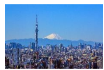
Tokyo Skytree (634m) et Mt Fuji