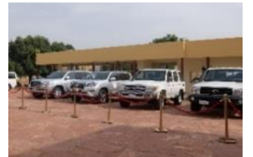
Matériaux roulants (Ecole de Maintenance de la Paix)