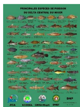
Etude sur les poissons du fleuve Niger

Le Japon est la 3 e économie mondiale et le membre du G7.