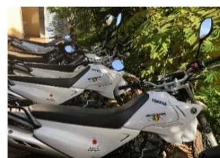
Equipements sécuritaires (Aéroport de Bamako)