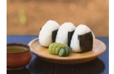
Boule de riz et soupe Miso