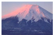
Mt Fuji (3 776 m)