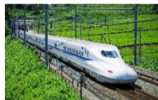
Shinkansen et champ de thé