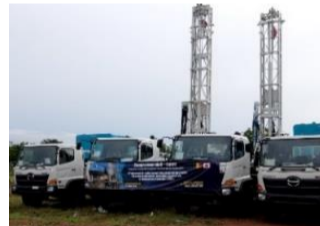
Grandes foreuses (Ministère de l'Energie et de l'Eau)