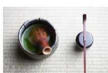
Sado : l'art du thé japonais