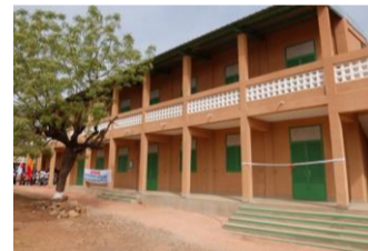
Nouvelles classes (Ecole Point G)