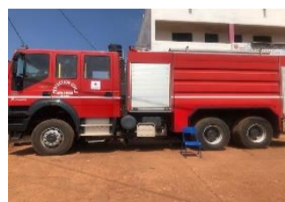
Camion grue (Direction Générale de Protection Civile)