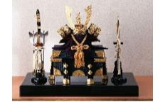
Fête des petits garçons