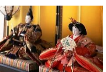
Fête des petites filles