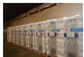
Congélateur vaccin Covid-19 (Ministère de la Santé et du Développement social)