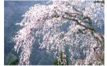
Cerisiers en fleur