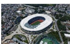
Stade national de Tokyo Lieu des JO TOKYO 2020