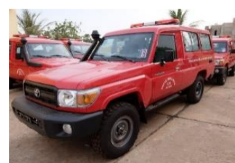
Ambulances médicalisées (Ministère de la Sécurité et de la Protection Civile)