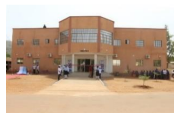
Nouveau bâtiment (Ecole Nationale de Police)